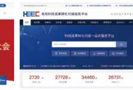
高校科技成果转化对接服务平台