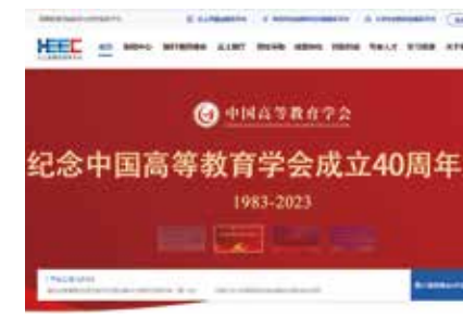
云上高博会服务平台

云上展厅是对传统线下模式高博会的一种延续，既是为高等教育领域服务商提供展示产品信息、推介产品优势的窗口，也为高校、科研院所等高等教育领域需求方提供了解产品最新信息的平台。