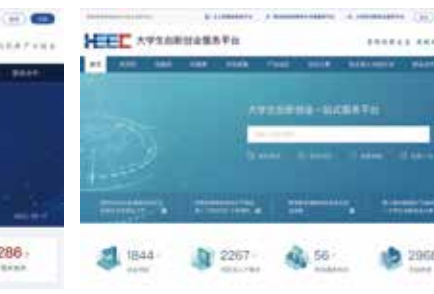
大学生创新创业服务平台