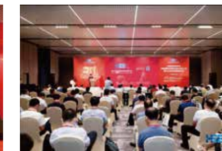
中国高等教育学会科技服务专家指导委员会成立大会