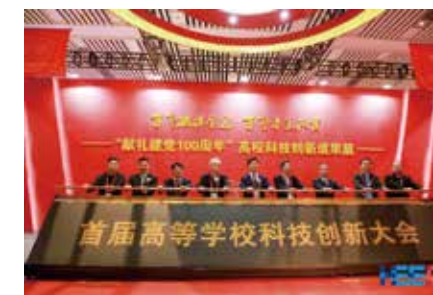
首届高等学校科技创新大会